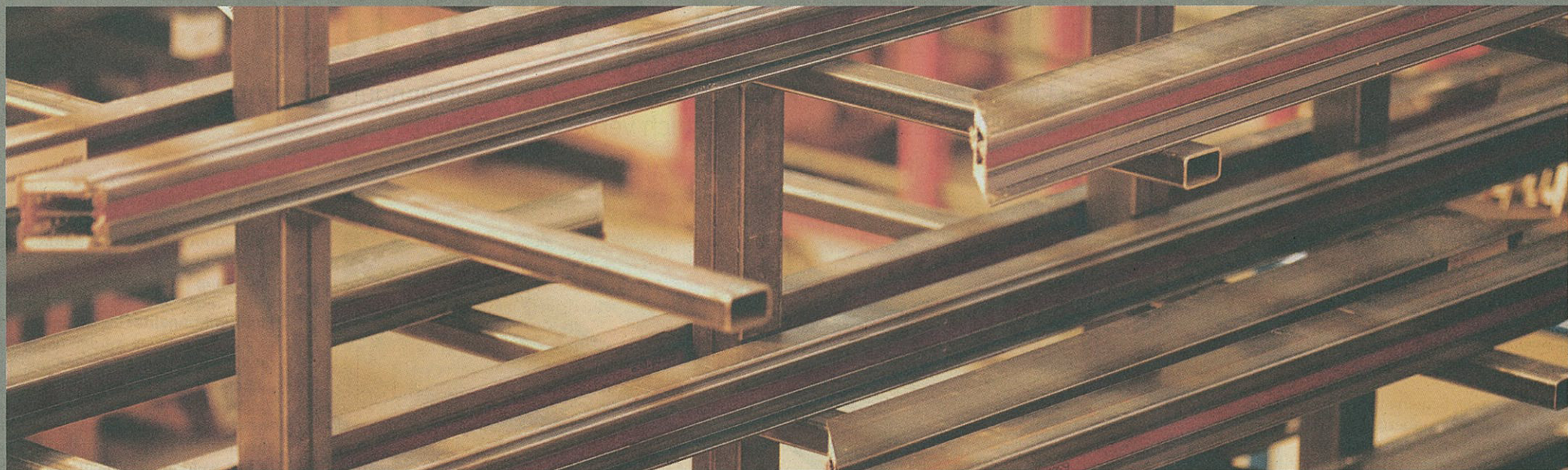
Leistungen: 44 Prozent der erbrachten Logistikleistungen in der Schweiz entfallen auf den Transport, gefolgt von der Lagerung mit 23,5 Prozent.